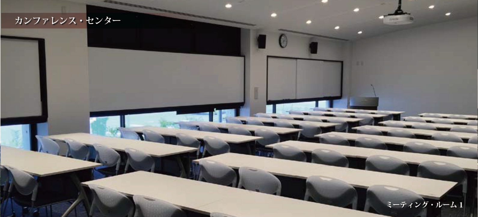
ミーティング・ルーム 1