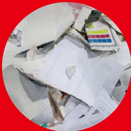
Paper waste 紙ごみ

Do not bring your household waste to OIST Waste Collection Areas.