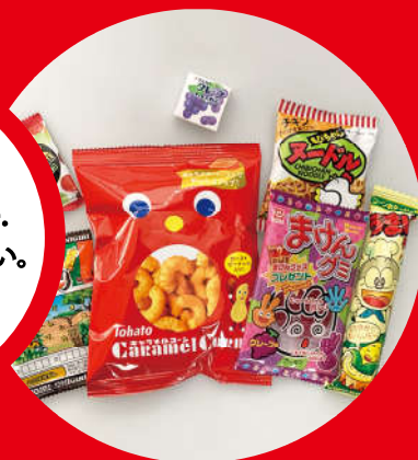
Snack food packaging お菓子の包装