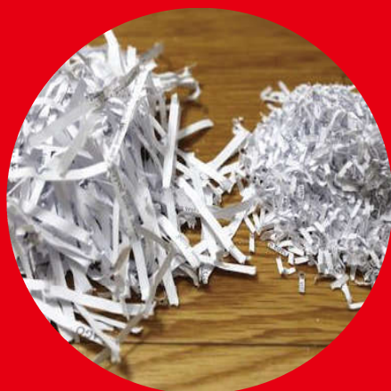
Shredder garbage シュレッダーごみ