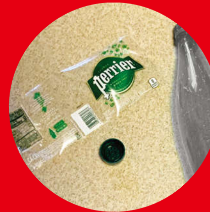
Bottle labels and caps ペットボトルのラベルとキャップ