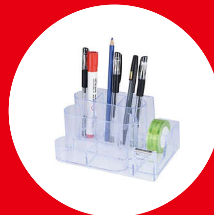
Plastic products / Stationery プラスチック製品 / 文具