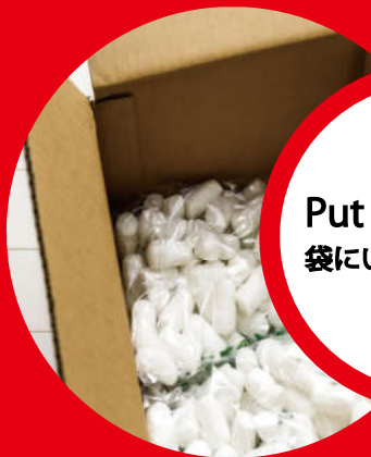
Packing materials 梱包材