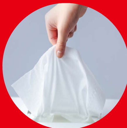
Tissues and Paper towel ティッシュとペーパータオル