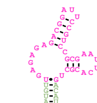
図 2. 遺伝子発現を制御するリボスイッチの構築に用いられる低分子化合物 (ASP2905) と RNA アプタマー (AC17-4)。