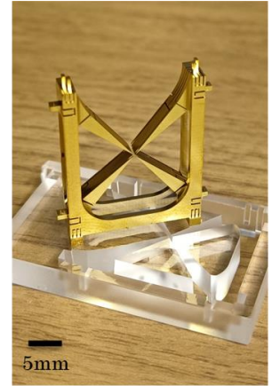
図 1：金メッキを施した 3D プリント・イオントラップと、それを機械加工したガラス基板

キーワード： 量子コンピューティング、量子ネットワーク、量子インターネット、イオントラップ、共振器 QED